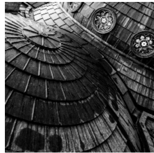
Sanctuaires de Lourdes - D. Banks