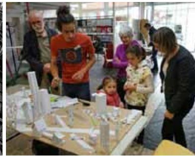
Archicity - Parcours d'Architecture