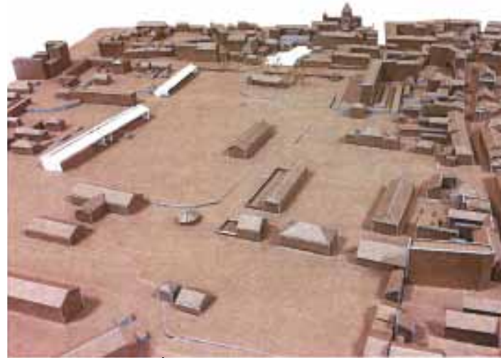
Maquette des Haras - Étudiants de l'école d'architecture de Paris-Belleville